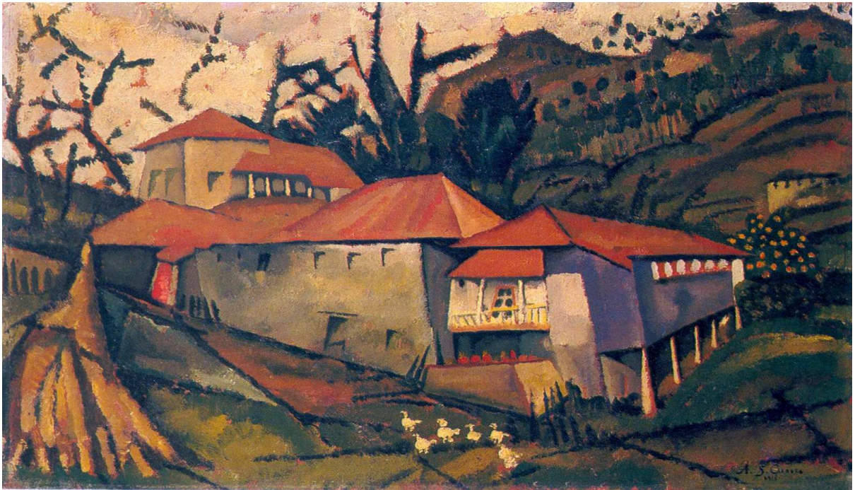
3) A casa do Ribeiro 1913 Óleo sobre madeira 29,5 x 51,7 cm Colecção José Ernesto de Souza-Cardoso