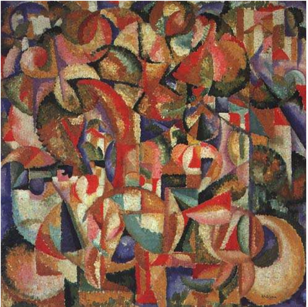
5) Cavaleiros 1913 Óleo sobre tela 100 x 100 cm Musée National de Arte Moderne, Paris – França