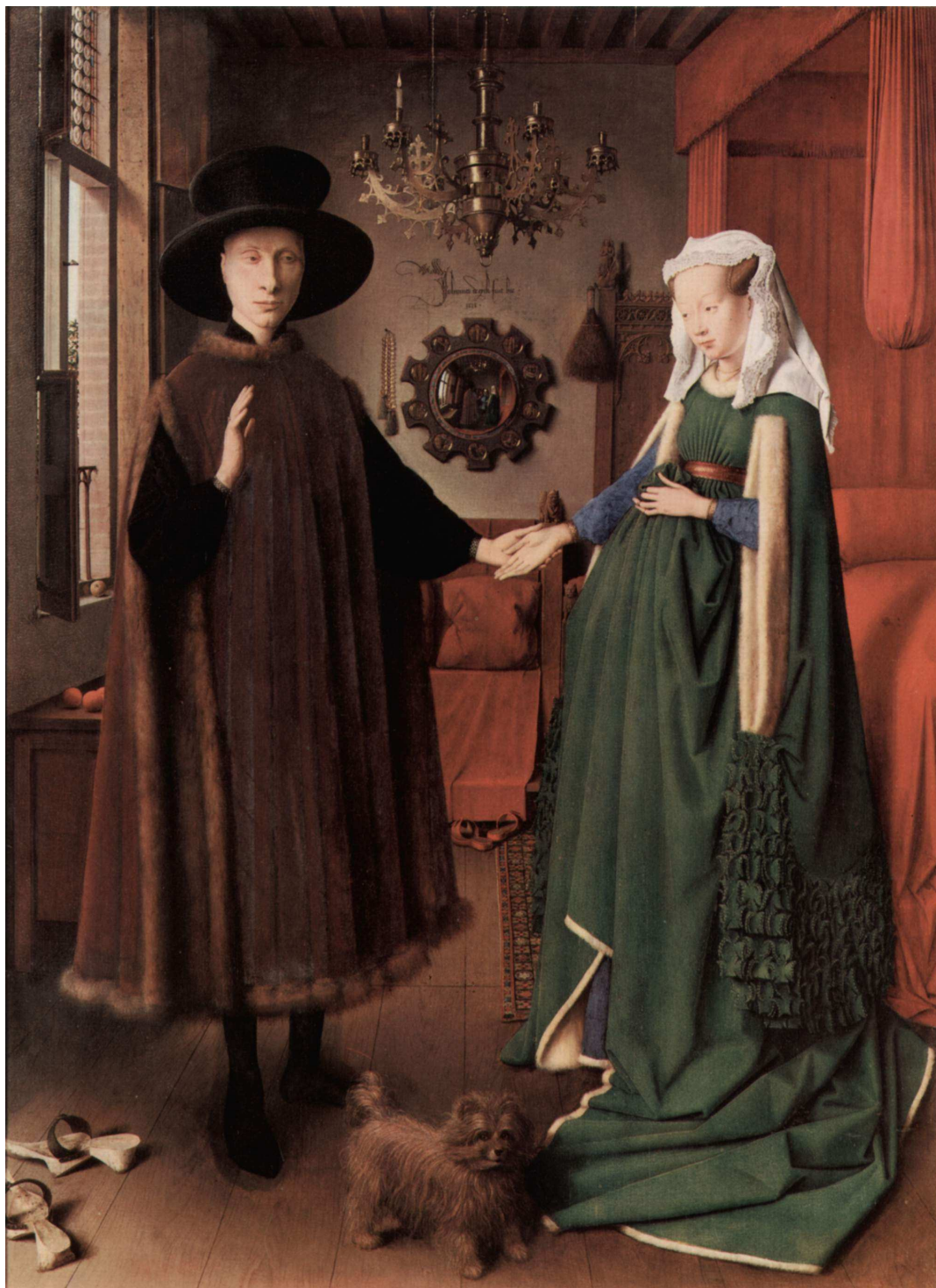
2) O Casal Arnolfini – Jan Van Eyck 1434 Óleo sobre tábuia de carvalho 82 × 59,5 cm National Gallery, Londres - Inglaterra