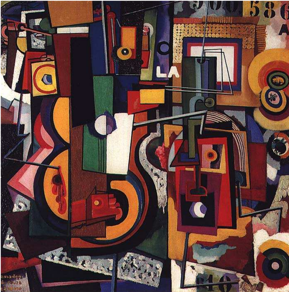
8) Pintura 1917 óleo sobre tela 86 × 66 cm Centro de Arte Moderna José de Azeredo Perdigão, Lisboa - Portugal.